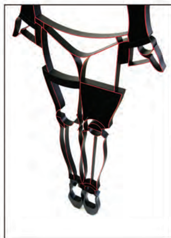
「2013 type - A」